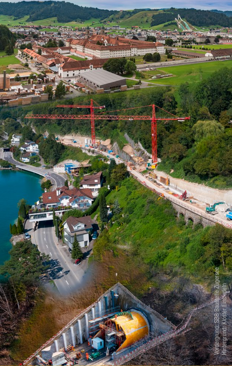
Vordergrund: SBB Baustelle Zugersee Hintergrund: Kloster Einstedelin

Wir wünschen ein tolles Zentralfest und wunderbare Momente unter Freunden